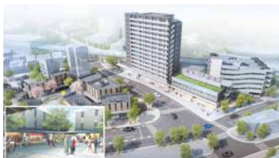
海岸通地区市街地再開発事業