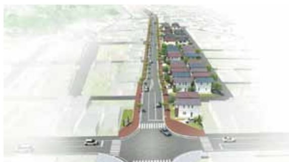
藤倉地区土地区画整理事業