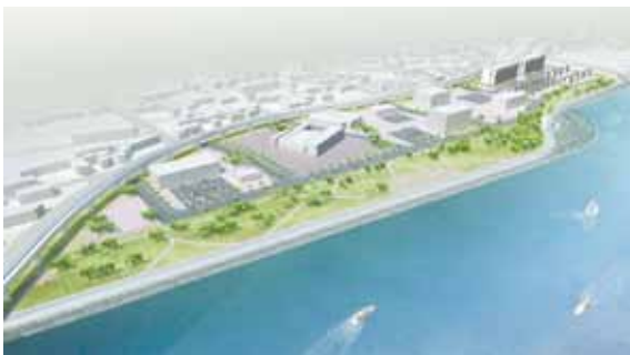
北浜地区土地区画整理事業・北浜緑地護岸整備