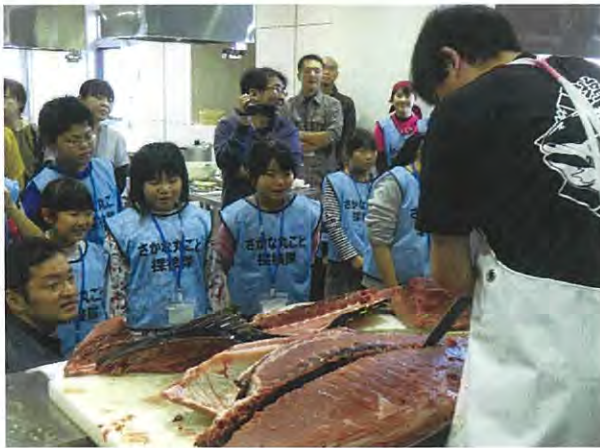
↑平成30年11月11日開催 「マグロ教室の様子」