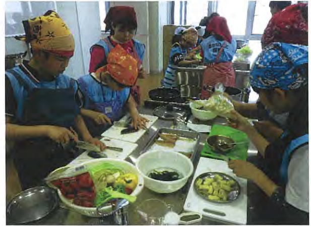
↑令和元年5月11日開催 「サバ教室の様子」