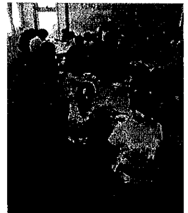
清水沢東こどもカフェ