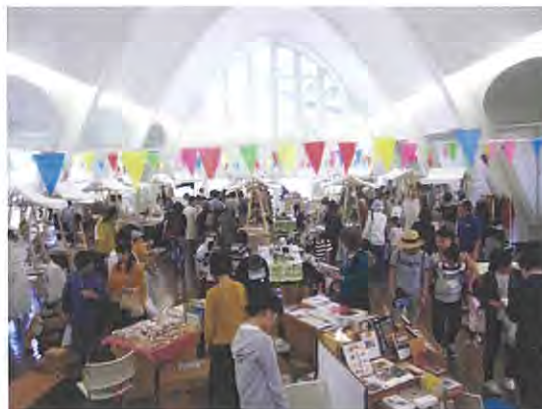
▲大講堂は、お気に入りの商品を求めて、大勢のお客さんで賑わいます