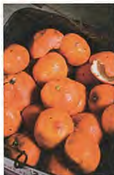
<<一枚皮だからな、我々は。>>

塩竈フォトフェスティバル2016写真賞大賞の受賞作。同世代の女性たち、生まれ育った和歌山の自然、愛犬や家族との日常を、みずみずしい感性で掬い上げた。