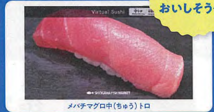
メバチマグロ中(ちゅう)トロ

さかなや りせきまき さいげん 魚屋さんの店先の再現や、お すし屋さんのカウンターでの バーチャル や 鮭体験などで、 さかな 魚 に関する かん 知識を ち しき 深めます。