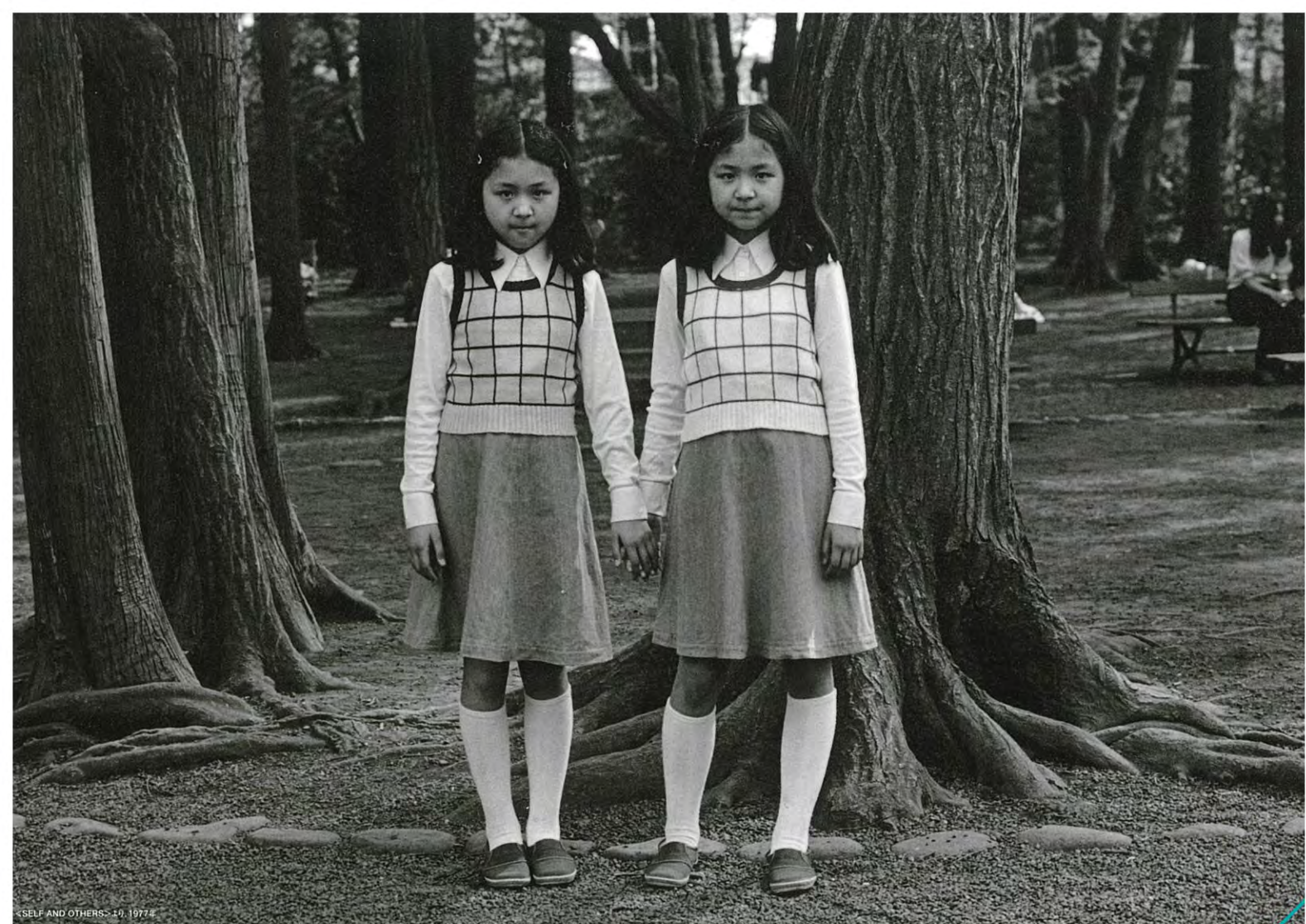
SELF AND OTHERS - 19, 1977