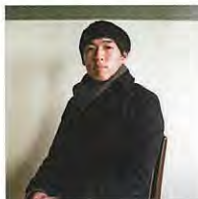
<<ひとりできない>> ©横山大介

「自己」と「他者」をテーマに取り組んだ若手写真家たち(菱田雄介、横山大介、ほか)の視点を探ります。