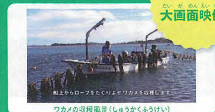
ワカメの収穫風景(しゅうかくふうけい)

のりやかき、わかめの養殖をは じめとする浅海漁業や、かまぼ こなどの水産加工業について、 映像や加工製品の実物展示を 用いて紹介します。