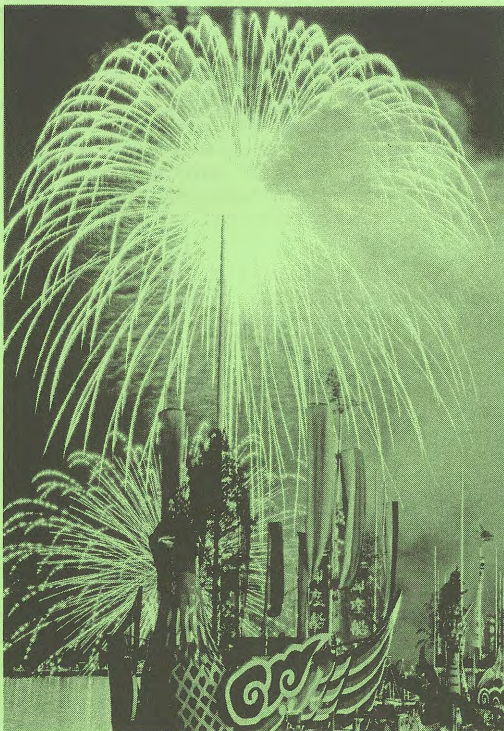
自由写真部門 特選「鳳凰、羽ばたく」 三浦一泰 (塩竈市)