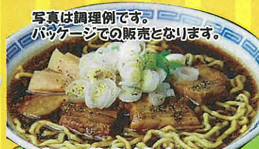
写真は調理例です。 パッケージでの販売となります。