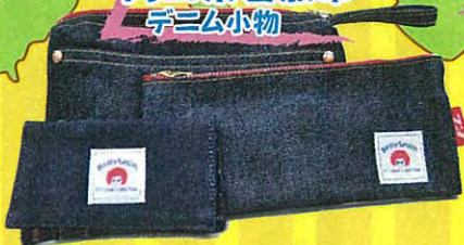
岡山県倉敷市 デニム小物