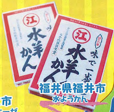
福井県福井市 水ようかん