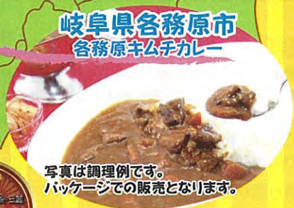
写真は調理例です。 パッケージでの販売となります。