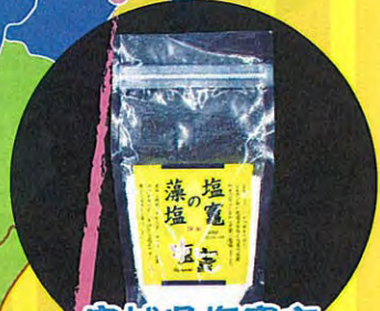
宮城県塩竈市 塩竈の藻塩