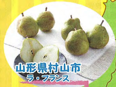
山形県村山市 ラ・フランス