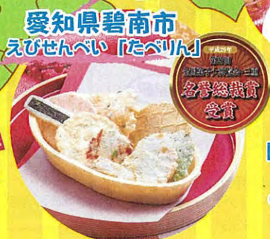
愛知県碧南市 えびせんべい「たべりん」