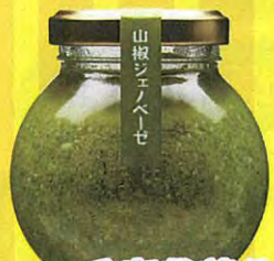
兵庫県養父市 朝倉山椒ジェノベーゼ