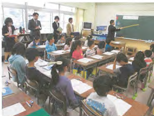
【コの字型の座席配置】