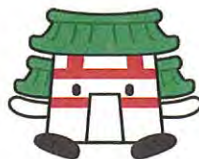
多賀城市：たがもん