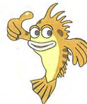
七ヶ浜町：ほっけのぼーちゃん