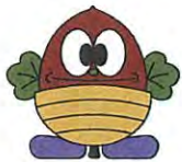
松島町：どんぶりまっちゃん