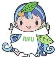
利府町：リーフちゃん