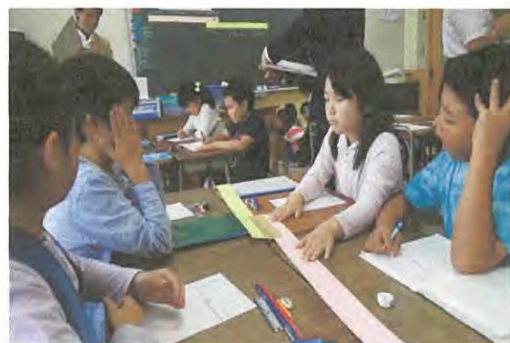
【4人グループでの学び合い】