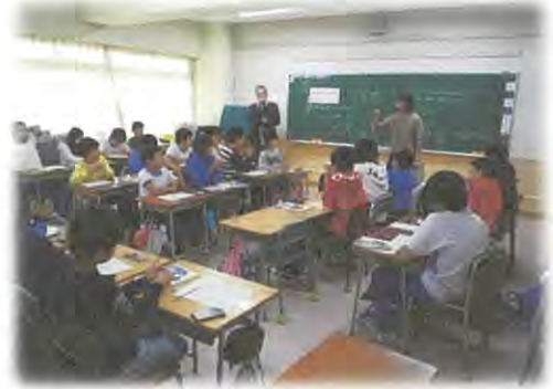
【協同的学びの授業】

この「しおがま『学びの共同体』による授業づくり」では、「一人も見捨てることなく、良さや可能性を伸ばす教育」という理念の下、どの子にも「できる・分かる」喜びを味わえる授業を目指しております。これまでの講義形式で行う一斉授業から、児童生徒の学び合いを基本とする「協同的学びの授業」に転換を図る新しい教授法をご紹介します。