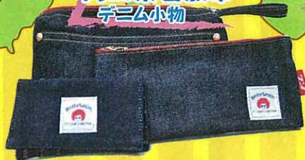
岡山県倉敷市 デミム小物