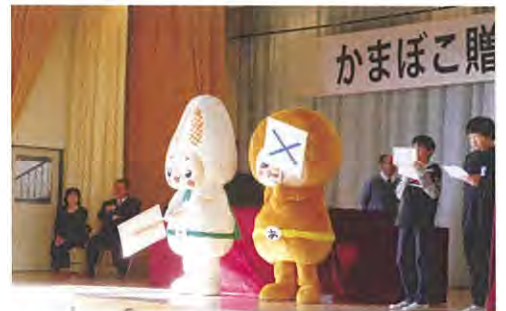
昨年度の贈呈式の様子（玉川小学校）

※1 蒲鉾が初めて文献に登場したのが、「1115年の関白右大臣が東三条への引っ越しの祝宴の膳に描かれていたもの」であることから、全国蒲鉾水産加工業協同組合連合会が、1983年（昭和58）に制定しました。