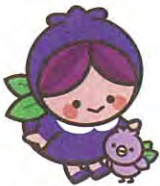
富谷市：ブルーリッ娘とブルピヨ