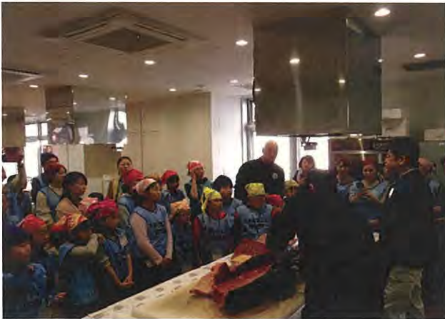
↑平成29年11月12日開催 「マグロ教室の様子」