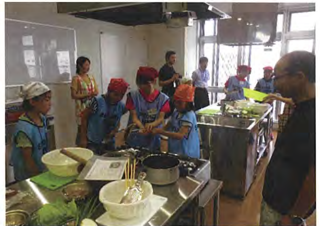
↑平成30年8月10日開催 「カツオ教室の様子」