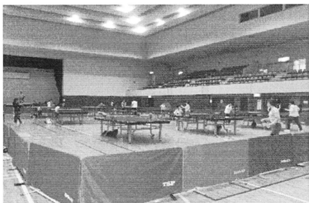
卓球を楽しむ親子