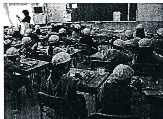
「へきなん玉ねぎ」を使用した給食 玉ねぎたっぷりポークカレー（塩竈市立第三小学校）

お問い合わせは、下記にお願いします。 塩竈市教育委員会教育総務課 保健食育係 TEL 022-355-8641（課直通）