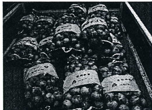
寄贈された「へきなんたまねぎ」