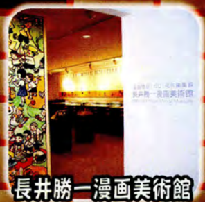
長井勝一漫画美術館