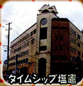
タイムシップ塩竈