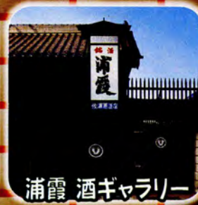
浦霞 酒ギャラリー