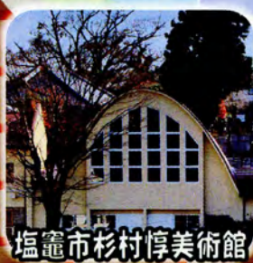
塩竈市杉村惇美術館