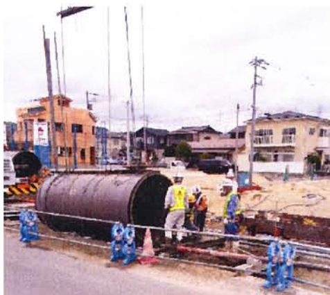
△下水道（雨水）の埋設状況 区画区域の東側半分（交差点部除く）が敷設完了しました。