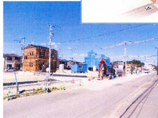
▲引き渡しが終わったところから、徐々に建築工事が始まっています。