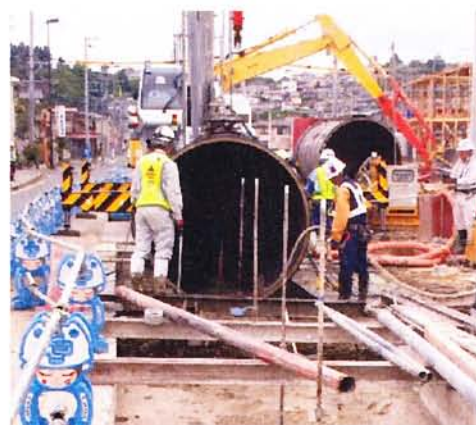
△直径1.8メートルの管を沈埋工法で施工しています。

周辺の皆さまには工事でご迷惑をおかけしております。 一刻も早い完成を目指して工事をすすめてまいります。