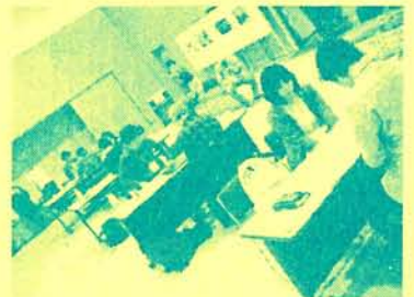
ポートフォリオレビューの様子