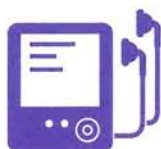
携帯音楽 プレーヤー