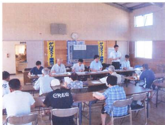
▲寒風沢地区入居者説明会の様子