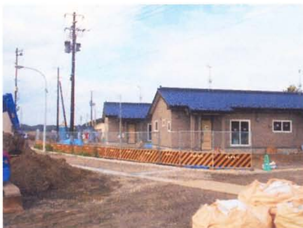
▲朴島地区災害公営住宅