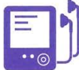
携帯音楽 プレーヤー