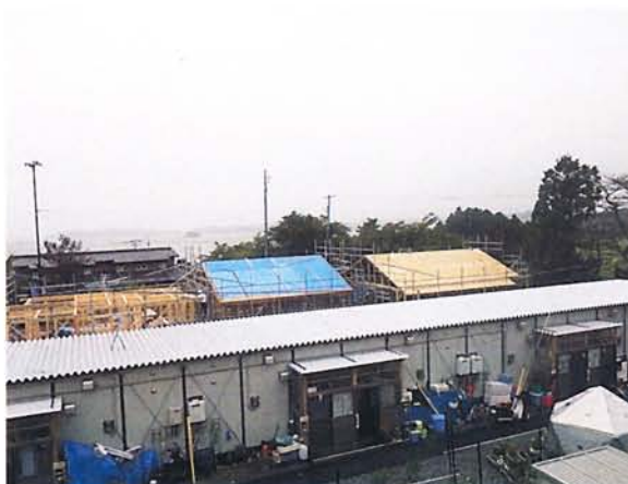
▲桂島地区Ⅱ期災害公営住宅