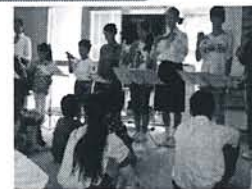
平成26年度：トーンチャイム等 （浦戸小・中学校）