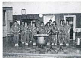
平成25年度：ティンパニ （第二中学校）