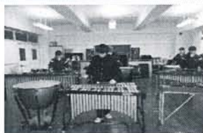
平成24年度：ビブラホン （第三中学校）