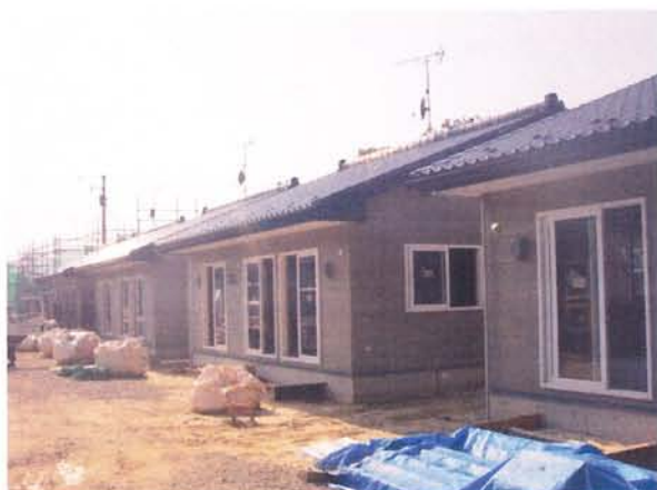
▲寒風沢地区災害公営住宅