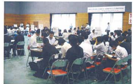
▲昨年は体育館で開催し、188名の生徒が参加

来春卒業見込みの高校生と事業所が一堂に会し、生徒が直接、事業所から事業内容や求める人材について聞くことにより、今後の就職活動の一助とし、就職促進・就職後の早期離職の防止及び職場定着の促進を図ることを目的として開催されます。