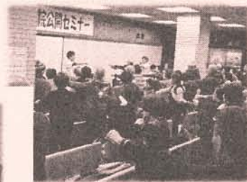
毎回好評の健康体操