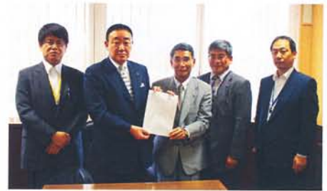
▲昨年は、商工会議所から訪問を開始

そこで、本市では、市、議会、公共職業安定所、地元高校の四者が連携し、地元高校の新規卒業生、障害者の求人拡大をお願いするため企業訪問を実施します。