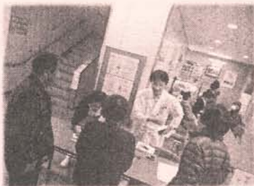
ストレスチェック等 各種相談コーナー