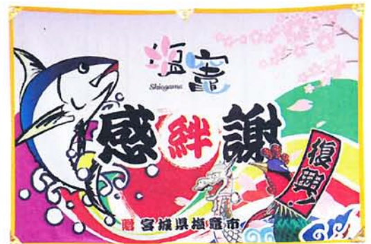
支援をいただいた自治体、団体へ贈った「大漁旗」