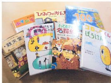
各学校が選定した本が寄贈されます （写真は小学校で選定した本）