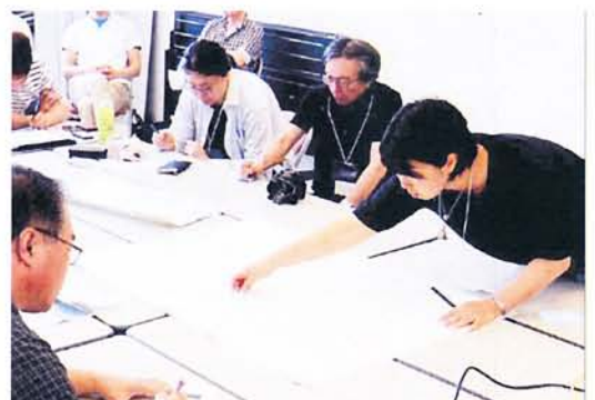
ワークショップ風景