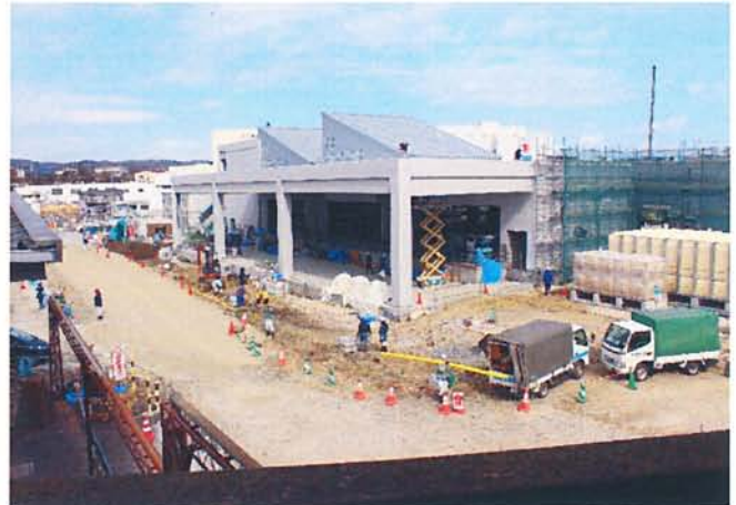
建設中の高度衛生管理型荷さばき所B棟 H27.2.25撮影