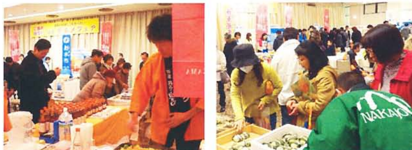
昨年度の逸品フェアの様子