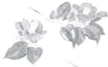
◀ 椿 ▶ 1945年頃

昭和21年～40年の20年もの歳月を塩竈で過ごした洋画家・杉村惇。今回は開館一周年記念をし、カメイ美術館の特別協力により、杉村惇の鋭い観察眼と作品制作への情熱をお見せすべく、塩竈時代に描いた貴重なスケッチ資料約45点を展示します。港町ならではの魚市場、そこで働く人々、瑞々しい鮮魚。敬虔に対象物へ向き合う杉村惇の精神が表れる当時の塩竈が鮮明に描かれています。また、戦後間もなく制作され、俳人・杉村颯道と洋画家・惇兄弟による合作『宮城県郷土かるた』の下絵も展示。宮城県の名所・名物等、珍しいモチーフが登場します。飽くなき作品制作への情熱が生んだスケッチの数々と、杉村惇の修練の軌跡をご覧ください。