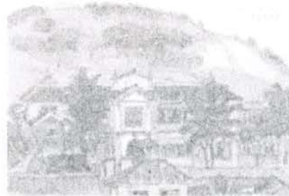
◀ 旧塩竈市庁舎 ▶ 1959年