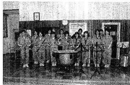
平成26年1月、ティンパニ1台が寄贈されました。(第二中学校)

〈問い合わせ先〉浦戸第二小学校・浦戸中学校 TEL:022-369-2008 塩竈市教育部学校教育課 TEL:022-365-3216