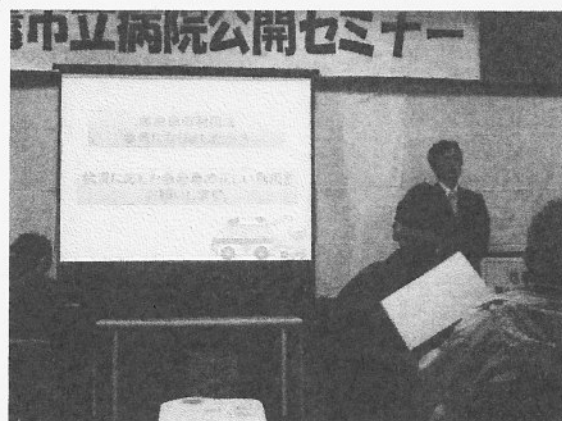
前回のセミナーの様子