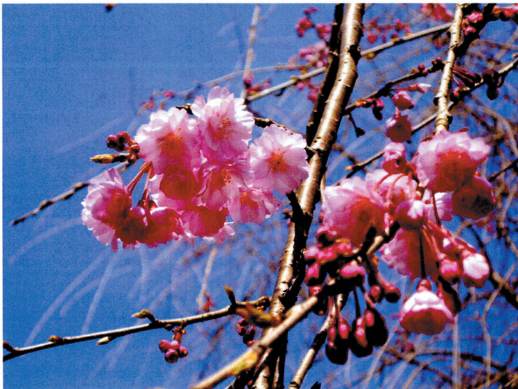
八重紅しだれ (イメージ)