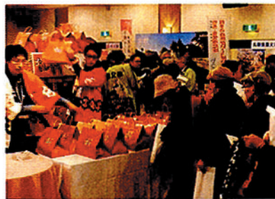
昨年度の逸品袋販売の様子