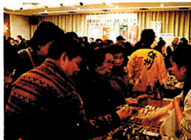
昨年度の逸品フェアの様子