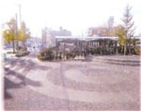
イベント広場・野田玉川の のたのたまがわ 小径 こみち (昼)

歌枕の地「野田玉川」の流れをイメージしたイベント広場。夜にはイルミネーションが螺旋状に輝いて、とってもステキ！