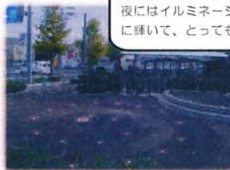
イベント広場・野田玉川の のたのたまがわ 小径 こみち (夜) ※イメージ

歌枕の地「野田玉川」の流れをイメージしたイベント広場。夜にはイルミネーションが螺旋状に輝いて、とってもステキ！