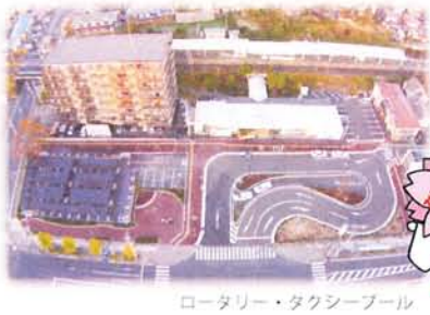
ロータリー・タクシープール

安全なロータリーとタクシープールに生まれ変わりました！桜・椿・ケヤキなど、たくさんの植栽が四季を彩ります！