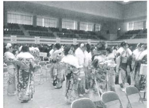
平成 26 年塩竈市成人で、旧友との再会を楽しんでいる様子です。

4. 日 時：平成 27 年 1 月 11 日（日） 12：30～ : 受付 13：30～14：00 : 式典 14：00～14：30 : 再会と交流の時間