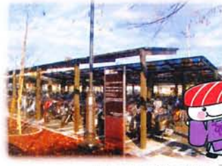
自転車・バイク駐輪場