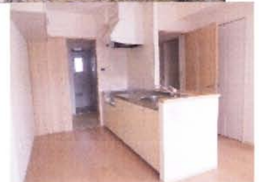
錦町地区災害公営住宅