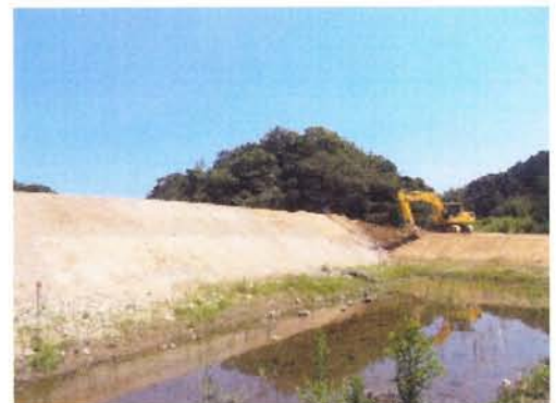
寒風沢地区災害公営住宅建設地