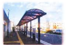
バス・タクシー乗場