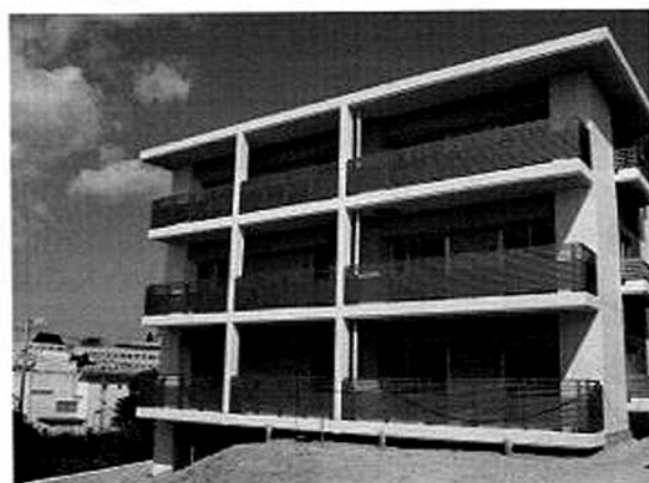
錦町地区災害公営住宅（3号棟）

10月8日に開催する区画整理審議会において、仮換地指定（2街区9画地）について提案し、仮換地指定が完了する見込みとなります。今後、移転協議が整い次第、除却工事に着手していきます。