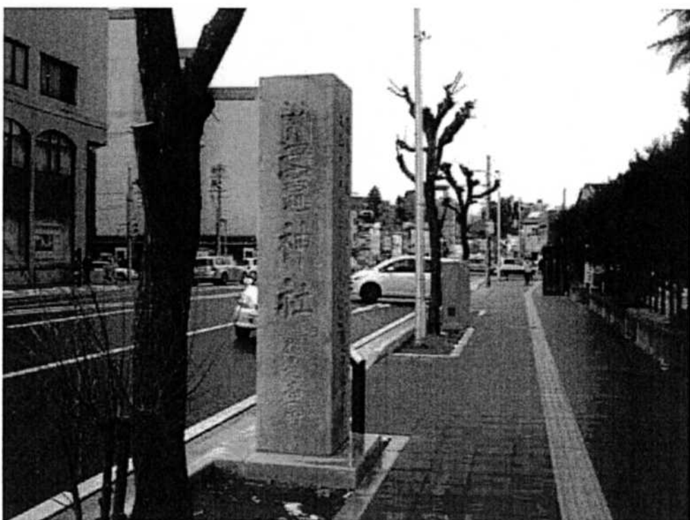
鹽竈神社道標 鹽竈海道起点（宮町側）