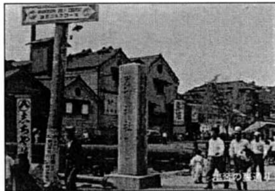
鹽竈神社道標 旧大河岸橋（常盤橋）脇