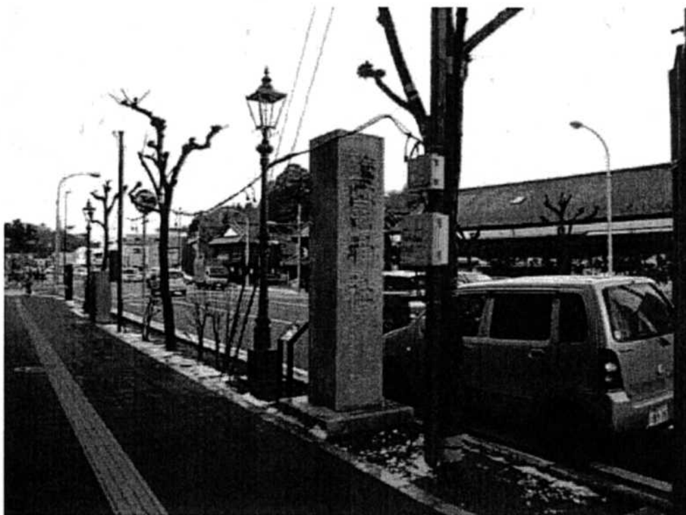
鹽竈神社道標 鹽竈海道起点（本町側）