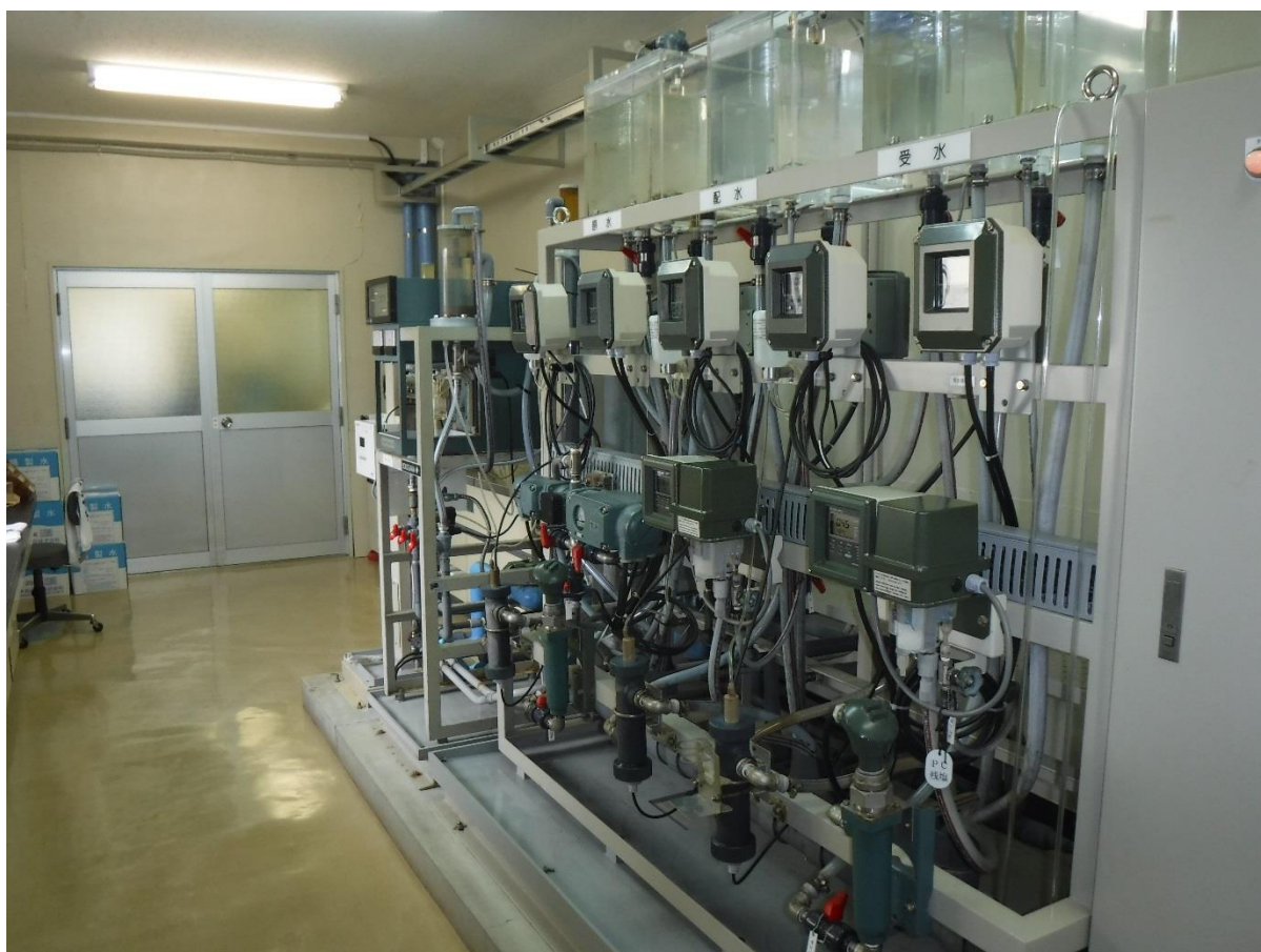
梅の宮浄水場・水質検査室