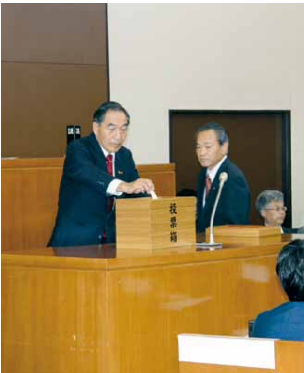
議長選挙行われる