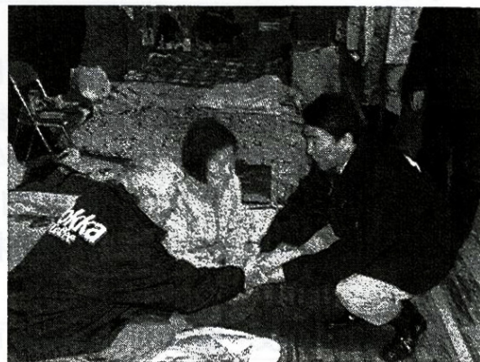
村井知事が被災者の皆様に激励