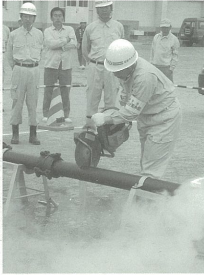
6月12日に塩竈市総合防災訓練が行われました。 水道部では緊急漏水復旧訓練と給水訓練を行いました。