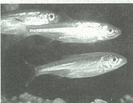
浄水場では、水源の水で淡水魚などを飼い、有害物質が混入していないかどうかを、常時監視しています。危険を知らせる心強いアドバイザー！

す。塩竈市の水源である大倉ダムからの原水の中では検出されたことはありませんが、詳しい検査については年に1回行っています。毎日検査以外の検査は全て仙台市水道局に委託して行っています。 このほかにも自動水質計による監視も行っており、24時間絶えず水の安全に気をつけています。特に原水(ダムから来たきれいな水)は、水槽で淡水魚などを飼い、異常があった場合には魚が知らせてくれる方法も取り入れています。