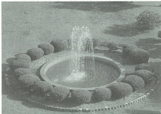
安全な水はきれいな環境からつくられます。梅の宮浄水場では環境美化を心がけています。【写真】梅の宮浄水場内噴水