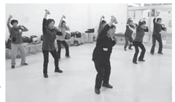
▲「ダンベルお助け隊」の体操教室としても利用されています。