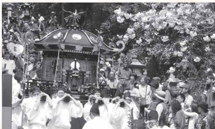
鹽竈神社花まつり(4月27日 市内)

「広報しおがま」は、22,450部製作し、1部当たりの経費(印刷・発送)は67円です。