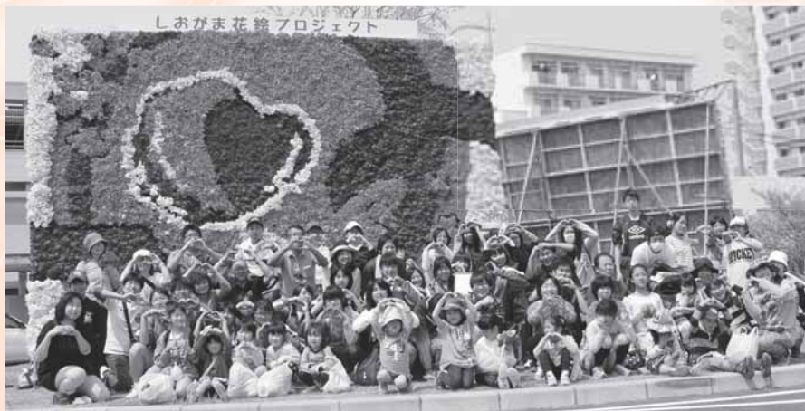
しおがま花絵プロジェクト(4月27日 本塩釜駅アクアゲート)