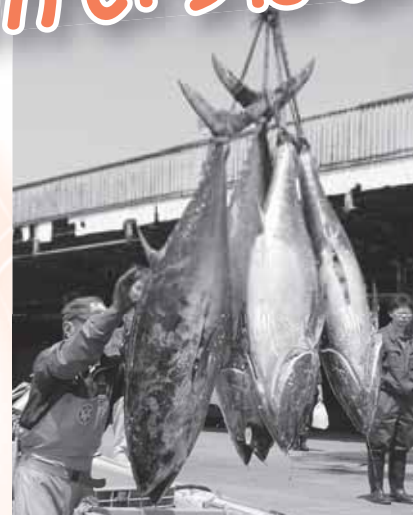
今シーズン初のホンマグロの水揚げ (5月7日 魚市場)