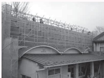
▲改修工事中的の本町分室