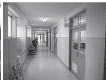
▲大規模改造工事を終えた第三小学校