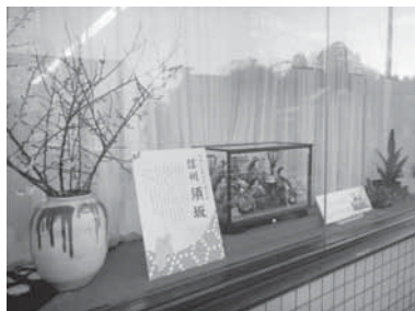
▲壱番館のショーウィンドウ