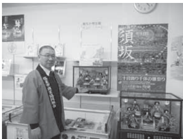
▲しおがま・まちな駅