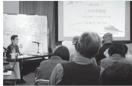
視聴覚センター講座「塩竈ものがたり」はシリーズ15回目。地域のお話しに熱心に耳を傾ける市民の皆さん。次回は来春3月を予定。(10月28日 視聴覚センター)

そのため、本書は話し言葉を使い、短い文章に編集するなど、若い世代にも親しみやすい工夫を施しています。