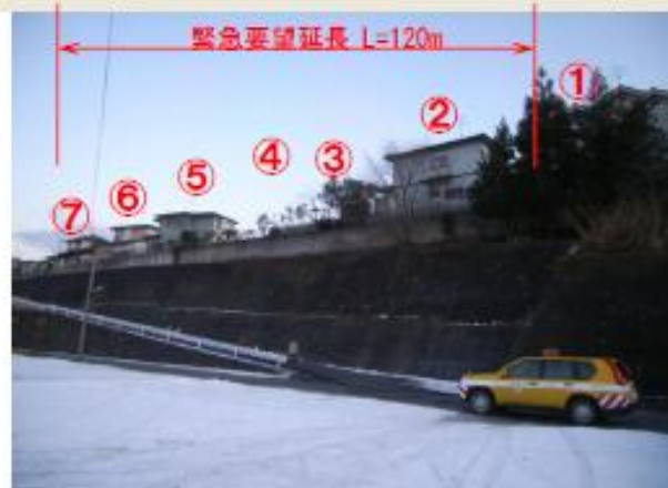
保全対象と斜面との位置関係