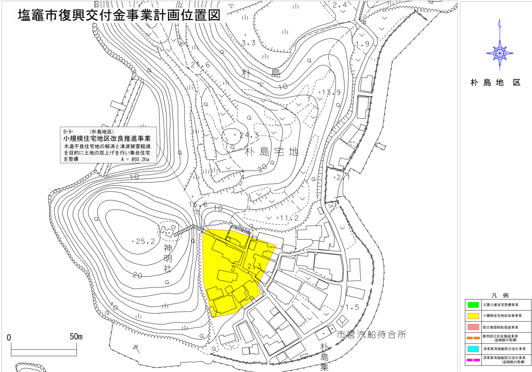
塩竈市復興交付金事業計画位置図