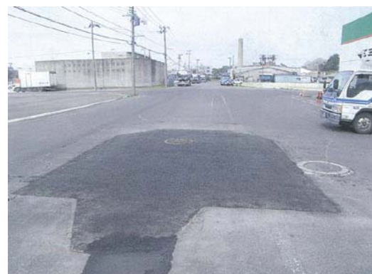
「マンホール高さ調整工事」 新浜町三丁目

問い合わせ先 : ① 都市計画課・定住促進課 364-1111 (内391) 平日の午前9時~午後4時 : ② 都市計画課 364-2510 : ③ 土木課 364-1118 : ④ 下水道課 364-2193