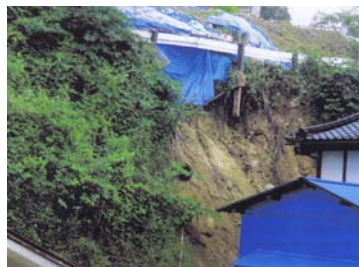
「のり面保護工事」 旭町