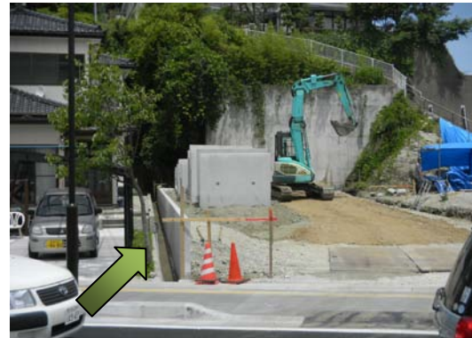
「かさ上げに伴う擁壁工事」 宮町