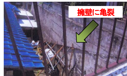
「擁壁の補強工」 泉沢町