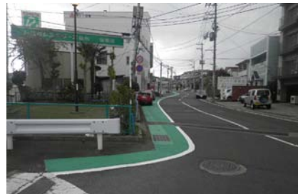
「路側帯カラー舗装」 錦町