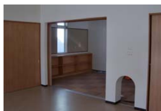
「藤倉児童館 内観」 ↑