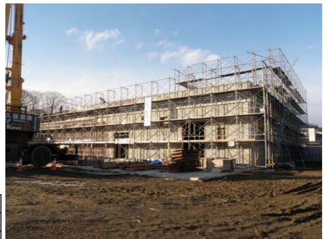
建築工事状況 平成24年12月25日

今年度は建築・電気・機械設備の工事を進めており、完成は平成25年度を目指しております。