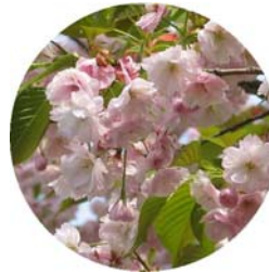
開花状況(イメージ) ↑ 植樹箇所 宮町 →

今春には桜の花が開花し、市民の皆様や観光客の目を楽しませてくれることが期待されます。