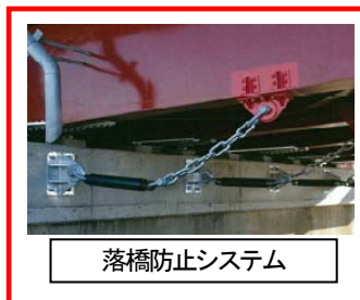
落橋防止システム