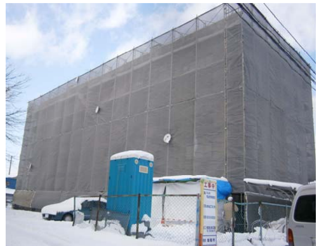
貞山通住宅 工事外観

新浜町住宅では、安全・安心な水の供給のため、現行の受水槽方式から直結直圧方式に変更していきます。