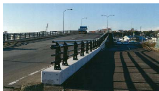
←貞山大橋 貞山通三丁目から芦畔町 方面を望む