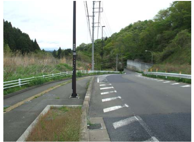
▲整備区間(庚塚パーキング付近から吉津集会所方面を望む) 付近から吉津集会所方面を望む

三陸縦貫自動車道利府中ICと国道45号を結ぶ一般県道利府中インター線は水産物の流通、地域の観光振興、さらには、仙台都市圏東部地域の外環状道路として、重要な役割を果たす広域道路です。