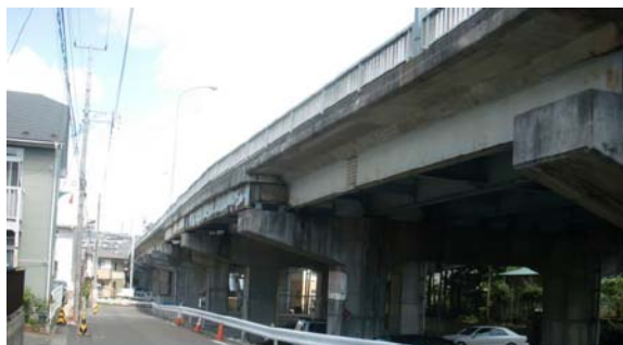
↑ 塩釜陸橋 側面