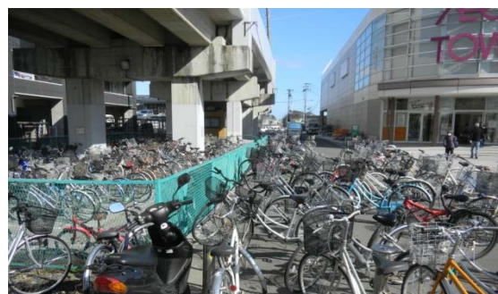
▲本塩釜駅前駐輪場の状況