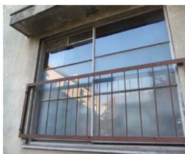
貞山通住宅 鋼製窓枠↑