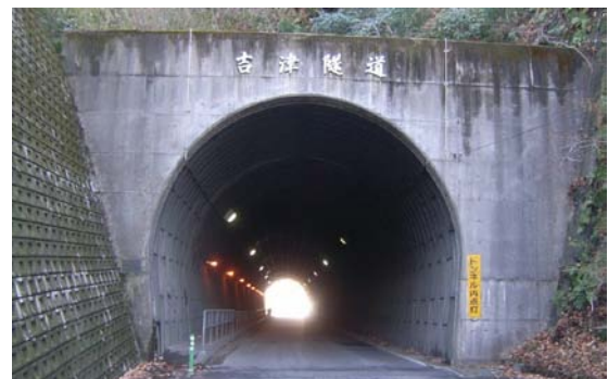
↑ 吉津隧道入口 北側