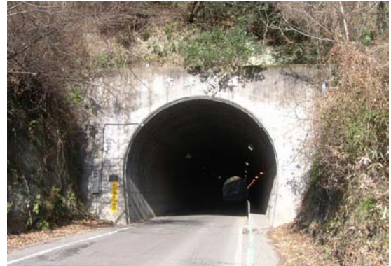
↑ 吉津隧道入口 南側