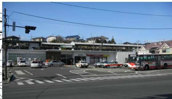
▲塩釜駅前広場の状況