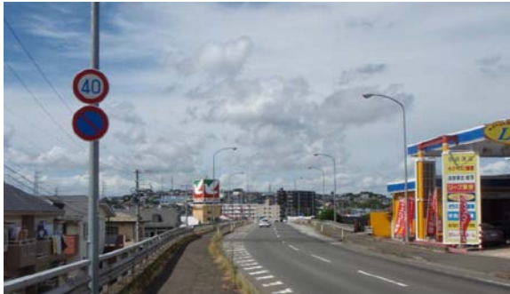
↑ 塩釜陸橋 橋面

国の平成24年度補正予算を活用し、道路橋梁14橋とトンネル3カ所の損傷状況を点検・調査して、今後の対策のための基礎資料を収集します。