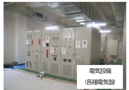
電気設備 (各種電気盤)