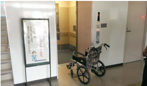
車椅子仕様で内部には手すりも付いています

塩竈市保健センターで設置工事を進めていました、エレベーターと太陽光発電システムが完成しました。 エレベーターは 11 人乗り（車椅子仕様）1 基を入口正面に設置。妊産婦や乳幼児、高齢者の方々の利便性が向上しました。 また、太陽光発電システム（容量 10kw）を導入。併せて、屋上の防水改修工事も行いました。