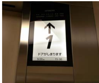
音声と文字表示で案内します