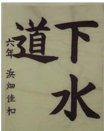
【書道部門 上学年の部】