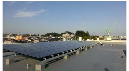
屋上には 60 枚のソーラーパネルを設置