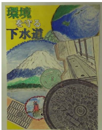
【絵画ポスター部門】

小中学生の下水道事業への理解を深めるとともに、子どもたちの作品展示を通して、下水道事業や家庭などでの水洗化普及の啓蒙を図る目的で開催しています。各部門の「市長賞」を受賞した作品をご紹介します。