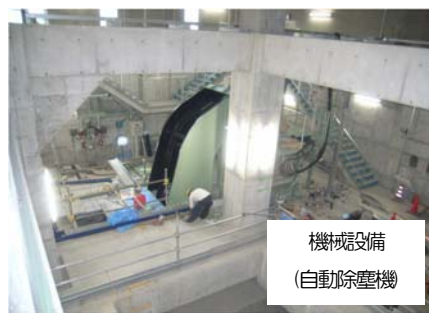
機械設備 (自動除塵機)