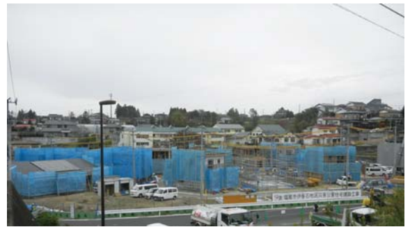
31 戸の住宅の他、集会所や公園なども整備します。(11/15 撮影)