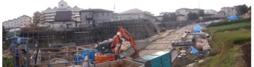
↑ 現在施工中の母子沢地区の法面