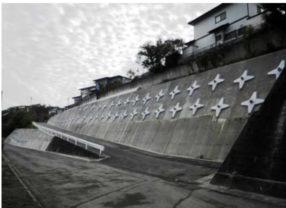
完成した青葉ヶ丘地区の法面

対策工としてグラウンドアンカー工法を採用し、法面を安定させることで地域の安全を守ります。なお、藤倉二丁目地区と母子沢地区については、現在、急ピッチで工事を進めております。