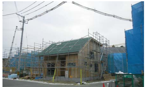
建設中の 2 階建 3DK タイプの住宅 (11/15 撮影)