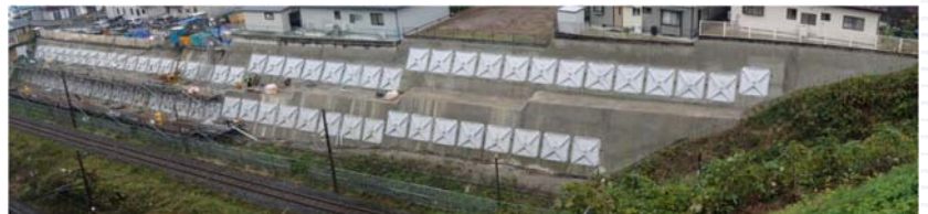
↑ 現在施工中の藤倉二丁目地区の法面