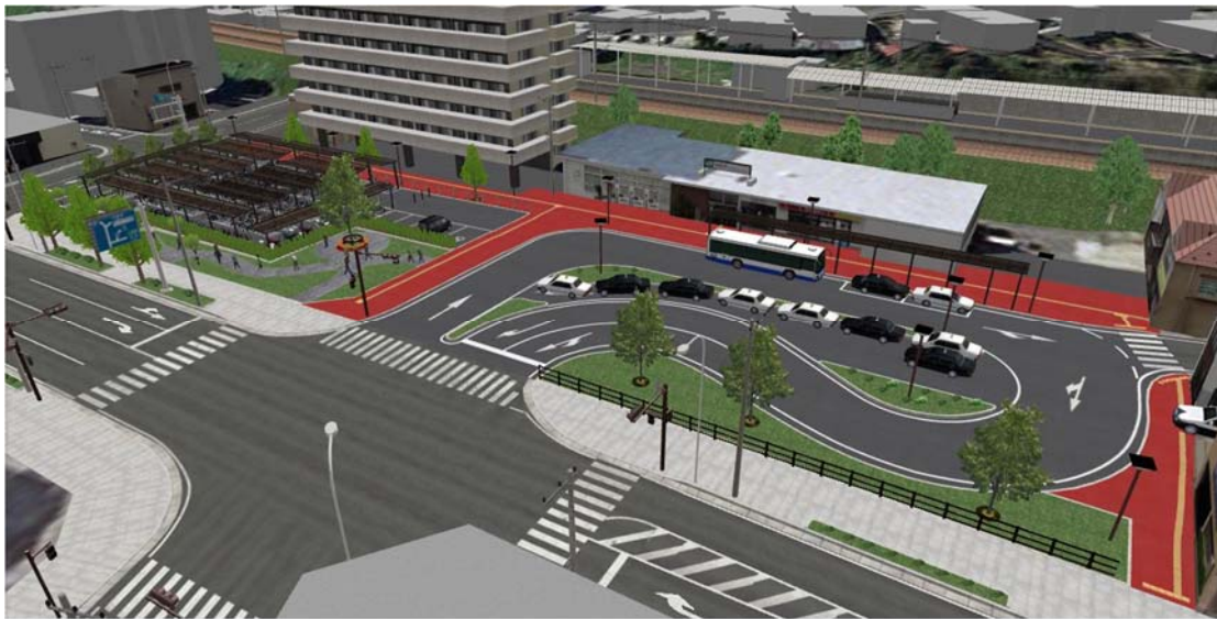
↑ 駅前広場・駐輪場の完成イメージ

年内の完成に向け、工事期間中は、バス停やタクシー乗り場、駐輪場の位置が変わりますので、ご理解とご協力をお願いします。