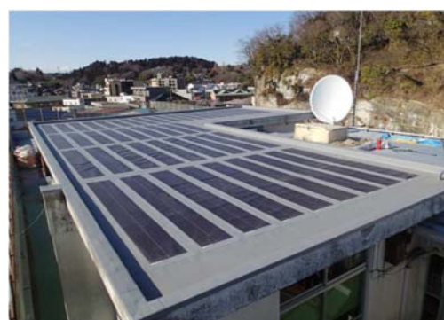
↑本庁舎屋上の太陽光パネル