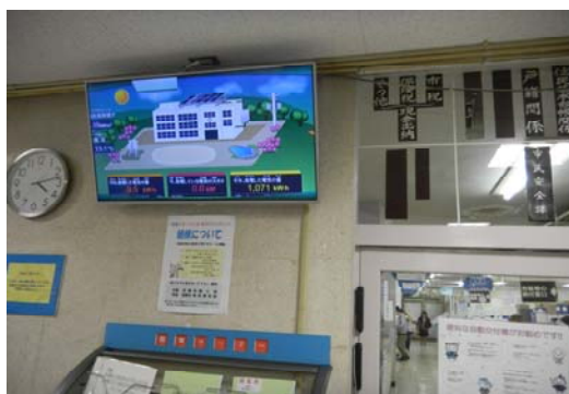
↑1階玄関ホールのモニター