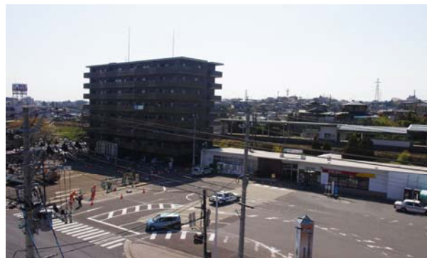
現在の駅前広場・駐輪場→

※工事期間中、駐輪場については、仮置き場を設けます。また、ロータリー部分についても仮のロータリーを設けます。工事による交通規制は、看板等でお知らせして、誘導員を配置します。