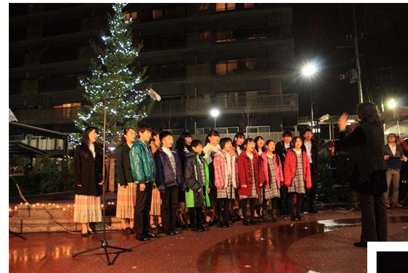
▲点灯と共にゆずりの葉少年少女合唱団の皆さんの歌声が響きました。

また、市民の集いの場として新設したイベント広場“野田玉川の小径(のだのたまがわのこみち)”では、『ゆずりの葉少年少女合唱団』と『塩釜高校ダンス部』による記念パフォーマンスが行われ、会場はクリスマスソングが美しく響き、躍動感あふれるダンスで、イベントを盛り上げました。