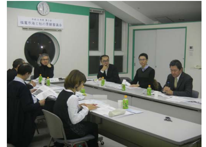
▼審査会では活発な意見が交わされました。