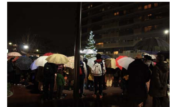
▲あいにくの雨でしたが、多くの方が訪れました。