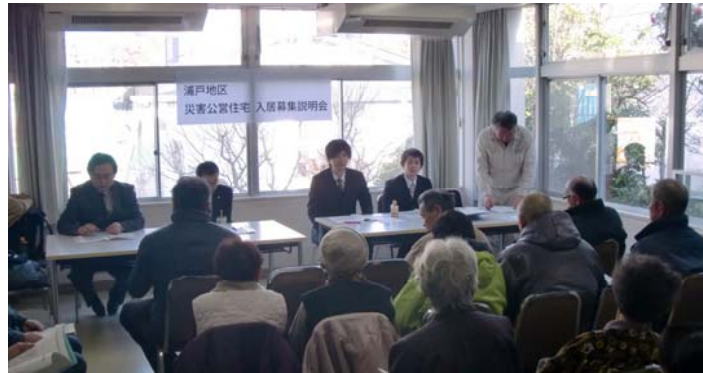
▼浦戸地区災害公営住宅入居説明会(ブルーセンター)