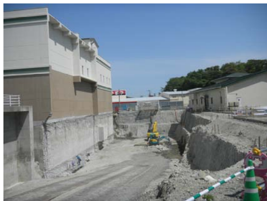
▼掘削工事（5月20日撮影）