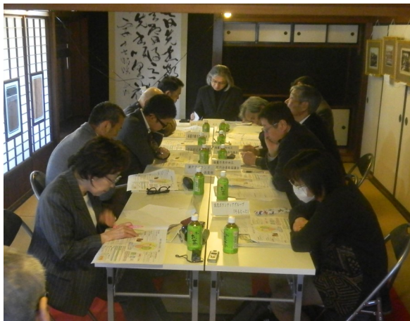
▼まちづくり懇談会の様子