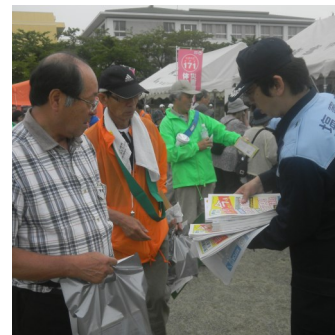
▲助成制度チラシ配布