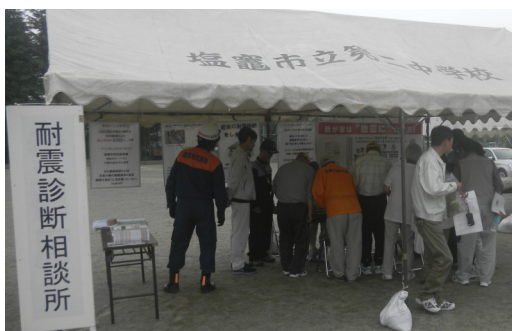
▲耐震診断相談所ブース

ブースに訪れた市民の方々は制度の説明を熱心に聞き、防災への関心を高めていました。