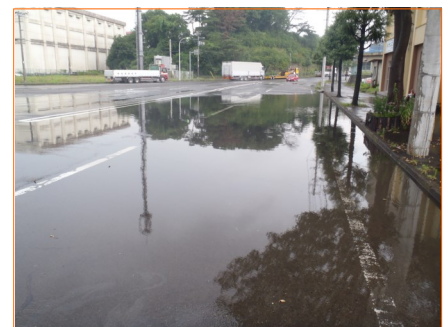
▲平成26年7月の大雨時の様子