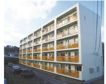
▲外壁等改修工事後の棟塚住宅