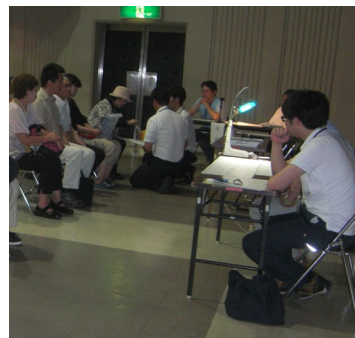
▲公開抽選会の様子

6月24日(水)、平成27年度市営住宅の公開抽選会を公民館で開催しました。抽選会には57世帯の皆さんが参加し、希望する住宅ごとに抽選を行いました。今回の抽選で入居する順番を決め、空き家が生じた場合、その順番で入居のご案内をしております。なお、抽選会の翌日から、随時募集の申込みも受け付けております。