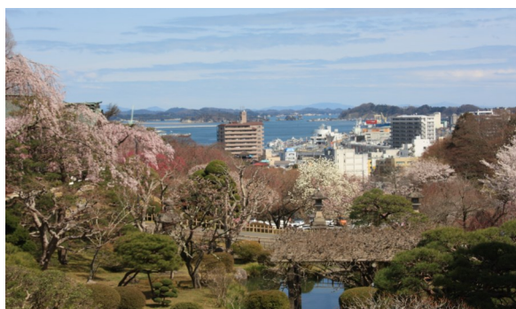
▲鹽竈神社からの眺望