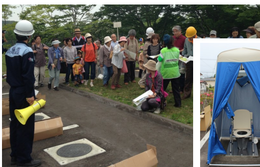
▲マンホールトイレ設置訓練