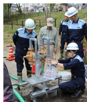
▲耐震性貯水槽からの給水支援訓練