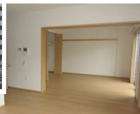
▲清水沢東災害公営住宅