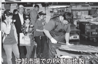
仲卸市場でのPR動画作製