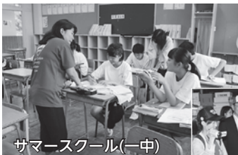
サマースクール(一中)

青山学院大学の学生ボランティア43人が、被災地支援の一環として本市を訪れました。8月5日～19日の期間中、2班に分かれて約1週間ずつ支援活動を行いました。教育支援活動ではサマースクールなどの学習支援、経済復興支援では浦戸の活性化に対する支援を行いました。