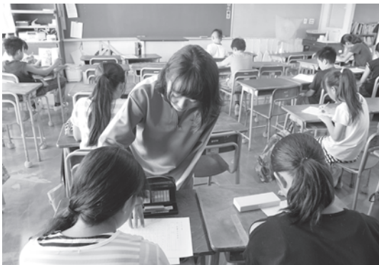
サマースクールで小学生に教える中学生 (スモールティーチャー)