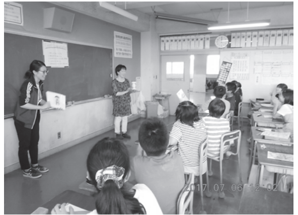
小学校の担任と中学校英語担当による「乗り入れ」授業

4月から小学校教員による中学校の数学の授業への「乗り入れ」を毎週3時間、中学校教員による小学校の外国語活動への「乗り入れ」を毎週4時間行い、小中学校で学習指導に連続性を持たせる取り組みを進めています。