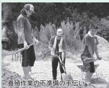
養殖作業の下準備の手伝い