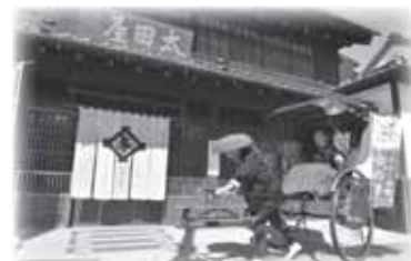
▲門前町で歴史や文化、景観などが楽しめます