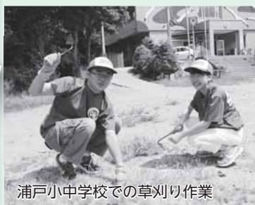
浦戸小中学校での草刈り作業