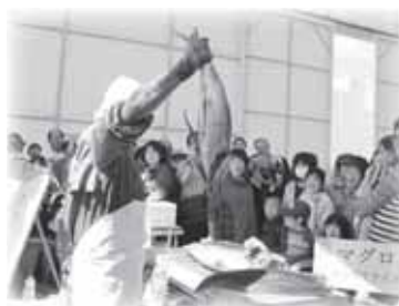
▲特産物を使った「食」のイベントがたくさんあります