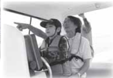
▲みなとまち塩竈で「海」と触れ合えます