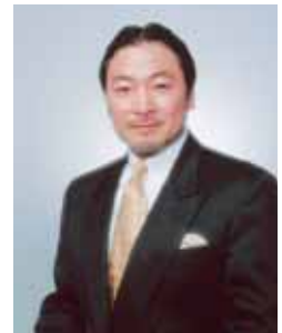
伊達家三十四世 仙台伊達家十八代当主 伊達恭宗氏