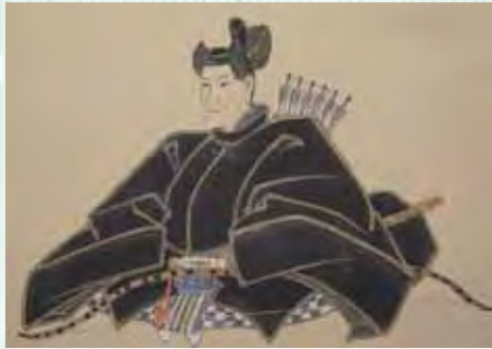
▲伊達綱村肖像[東園寺蔵]