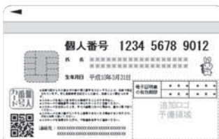
(裏)マイナンバーなどが記載、ICチップ搭載