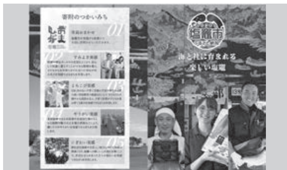
ふるさと納税パンフレット

安定した供給力を持っていること。本市ではサケとカニが人気であるが、それに続く全国的にもニーズがある商品をつくり出していきたい。また、年間を通して供給していただく業者を見つけていくことが課題解決のための体制確立につながるかと考えている。