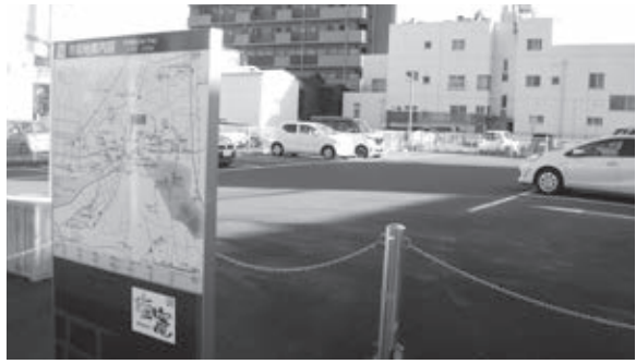
本町の商業施設跡地

議員 塩竈市統計書によると、本市を訪れる観光客数は、令和5年で200万人であった。塩竈の古い街並みなどに風情を感じることができ、重要