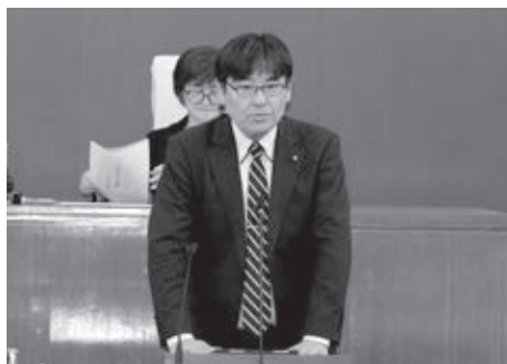
令和8年度予算特別委員会委員長報告

▼下水道事業会計は、下水道施設維持管理包括的民間委託事業において、必要不可欠なライフラインである下水道を持続可能とするため、包括的な民間委託を行うものである。今後も民間のノウハウを最大限に活用し、効率的かつ安