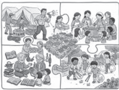
みんなで補完し合う地域づくり

議員 町内会の多くは、役員の高齢化や担い手不足により、厳しい運営状況にある。市は、補助金や物品の配布によつて